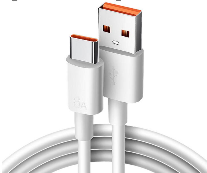
图 1 Type-c线

软件： FactoryTool_v1.89 工具、 DriverAssitant_v5.1.3 工具、 相应版本的 RK 系列板卡固件。